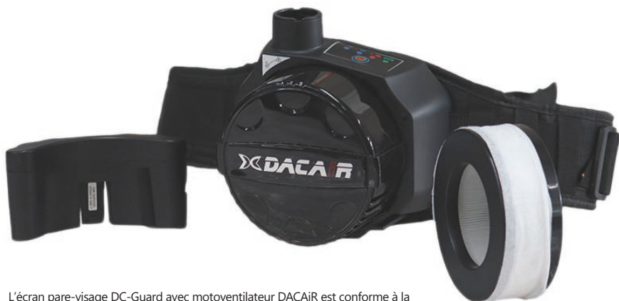
L'écran pare-visage DC-Guard avec motoventilateur DACAiR est conforme à la législation de l'Union Européenne 2016/425 et est certifié selon les normes EN166 3 9 B et CE EN 12941, classe TH2